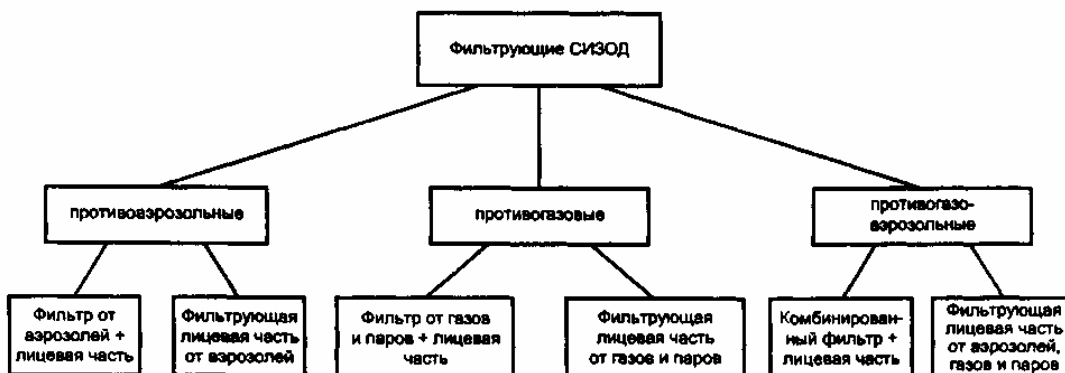
Рисунок 3 — Классификация фильтрующих средств индивидуальной защиты органов дыхания

Классификация фильтрующих СИЗОД представлена на рисунке 3.